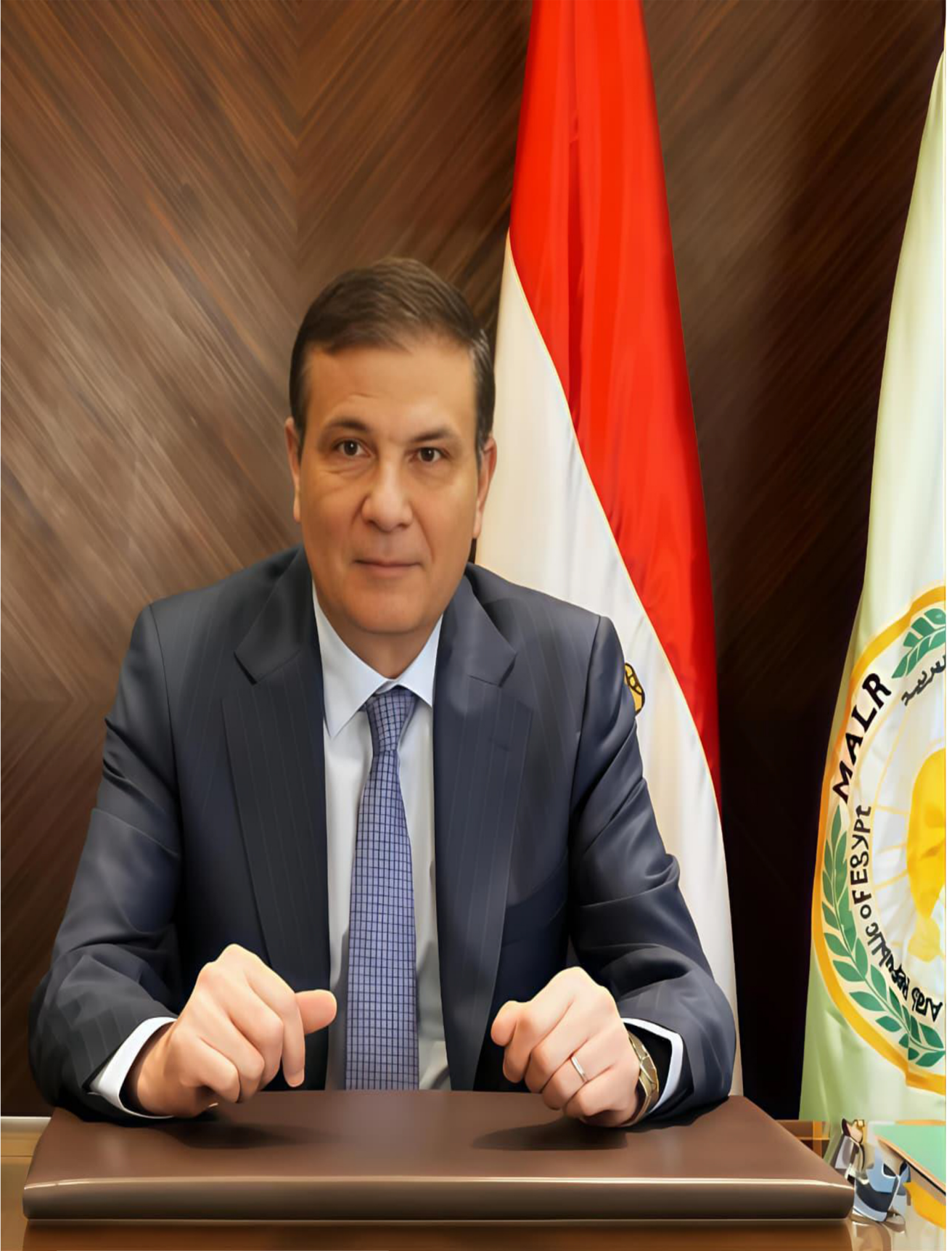
وزير الزراعة واستصلاح الأراضي أ/علاء الدين فاروق